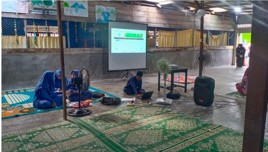
Gambar 2 Sosialisasi Website Madrasah